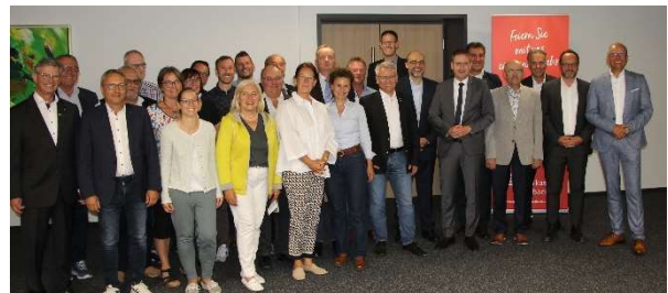
Teilnehmer Spendenübergabe

Die Sparkasse hat zu Ihrem 200. Geburtstag insgesamt 75.000 Euro an verschiedene Gemeinden im Landkreis verlost. Dabei hat der Markt Dürrwangen 3.000,00 Euro gewonnen.