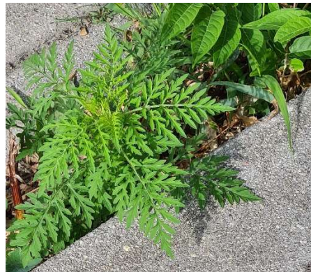
Bildunterschrift: So sehen Ambrosia-Pflanzen jetzt (im Juli) aus: Bild 1: mit Traubenblüten-Stand Bild 2: ähnlich junger Tagetes-Pflanzen

Fritz Allinger / Friedrich.allinger@svlfg.de