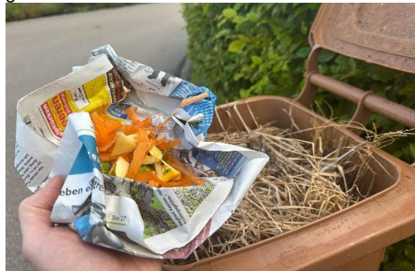
Unter anderem Zeitungspapier eignet sich in Maßen als geruchshemmende „Zugabe“ in der Biotonne. (siehe Bild: Biotonne im Sommer)

Die Temperaturen steigen und gleichzeitig auch der Geruch von Bioabfallbehältern. Mit der Wärme beginnt der Abbau von organischem Material bereits im Biobehälter, nicht erst in der Kompostieranlage. Die dadurch freiwerdenden Gase locken wiederum verstärkt Fliegen zur Eiablage an. Durch Beachtung einiger Grundregeln können der Geruch und weitere Begleiterscheinungen jedoch vermieden werden. Der Biobehälter soll möglichst im Freien an einem schattigen und kühlen Platz aufgestellt werden, da Wärme die Abbauprozesse und damit die Geruchsentwicklung und Madenbildung begünstigt. Der Boden des Biobehälters kann mit zusammengeknüllten Zeitungen, Eierkartons oder Pappe ausgelegt und die Bioabfälle in Papier (Bäckertüten, Zeitungspapier, Zellstoff-Küchentücher) eingewickelt werden. Das Papier nimmt das Sickerwasser der nassen Küchenabfälle auf. Auf diese Weise wird verhindert, dass sich Fliegen auf die Bioabfälle setzen und dort ihre Eier ablegen, woraus sich die unangenehmen Maden entwickeln. Biobehälter und Sammelgefäße in der Küche sollten wegen der Insekten stets geschlossen gehalten werden