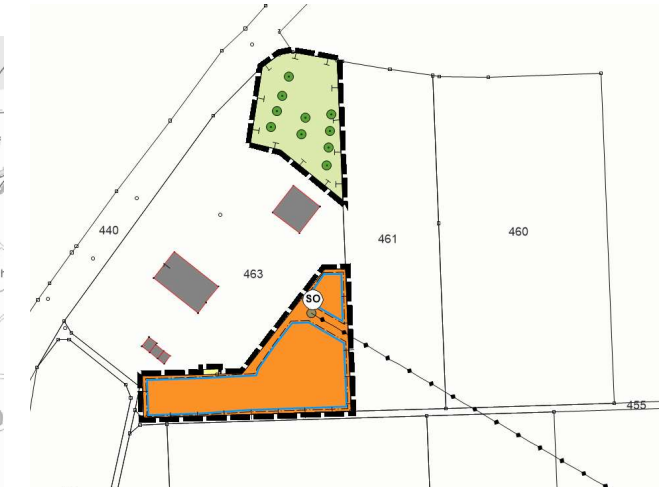
Die Lage und Darstellung des Vorhabens (maßstablos).

Ziel der Planung ist die Ausweisung eines Sondergebietes für eine Freiflächen-Photovoltaikanlage innerhalb eines nach dem Erneuerbare-Energien-Gesetzes „landwirtschaftlich benachteiligten Gebietes“, um dem Bedarf an erneuerbaren Energien zu entsprechen.