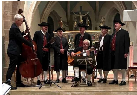
Die Dürrwanger Harles-Sänger stimmen mit Ihren Musikfreunden die Menschen auf die Weihnachtszeit ein (Foto aus letztem Jahr)

„Etzat is scho dr heilich Advent“ - Zur Musikalischen Einstimmung auf die „Staaede Zeit“ findet am 1. Adventssonntag, dem 01. Dezember 2024 in der Dürrwanger Pfarrkirche Maria Immaculata die zweite Auflage des Advents- und Weihnachtskonzerts statt. Beginn ist um 17.00 Uhr. Die Dürrwanger Harles-Sänger und der Pfarrgemeinderat Dürrwangen laden herzlich dazu ein. Die Besucher erwartet ein sehr anspruchsvolles Programm mit weihnachtlichen Klängen, Mundartgesang und Tanz. Die „Dürrwanger Weihnachtskinder“ (Gruppe der Chickpeas), der Gesangverein Dürrwangen und das Blechbläserensemble „Binders Blechla“ werden zusammen mit den Dürrwanger Harles-Sängern für stimmungsvolle Momente sorgen. Der Eintritt zu diesem musikalischen Erlebnis ist frei, um Spenden wird gebeten.